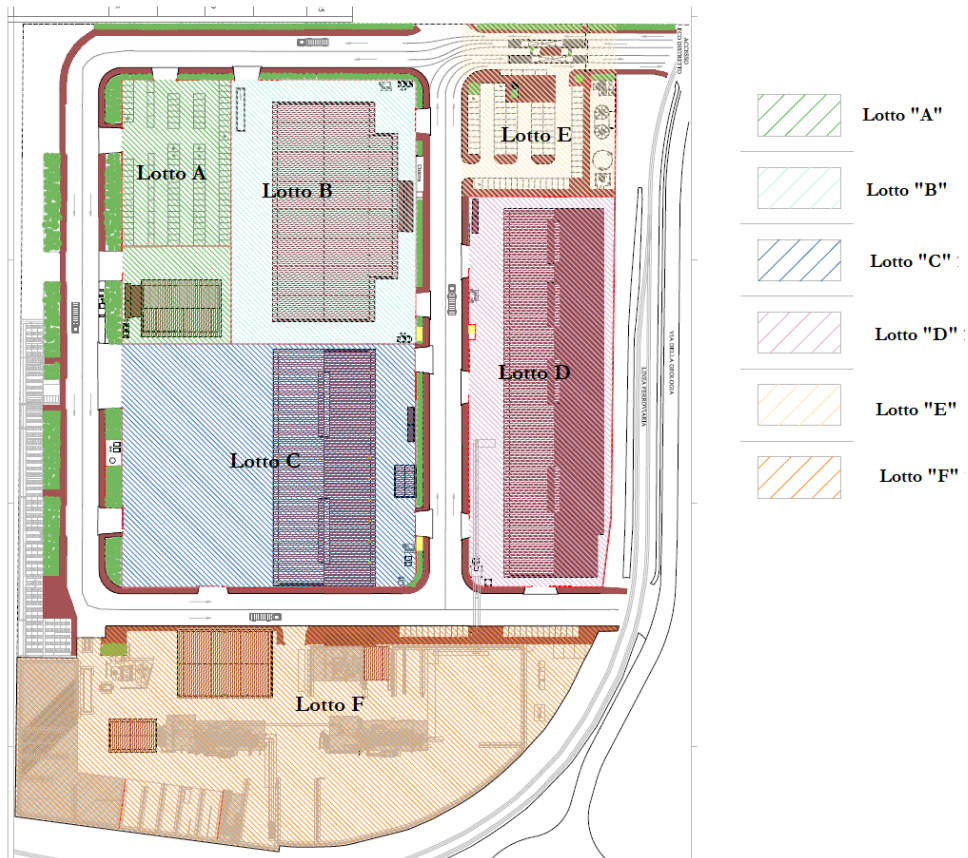
Immagine n. 1 – Lotti edilizi ed urbanistici – stato di progetto