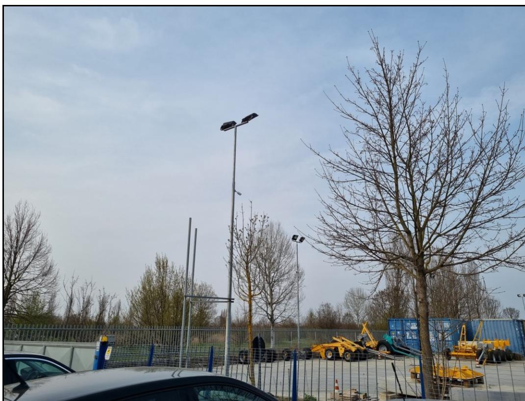
Figura 2: I punti luce visti dalla strada