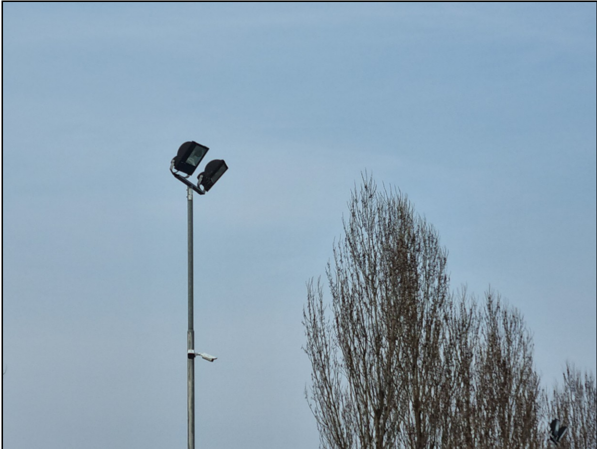
Figura 3: Particolare del punto luce

Si tratta di fari obsoleti che saranno demoliti.