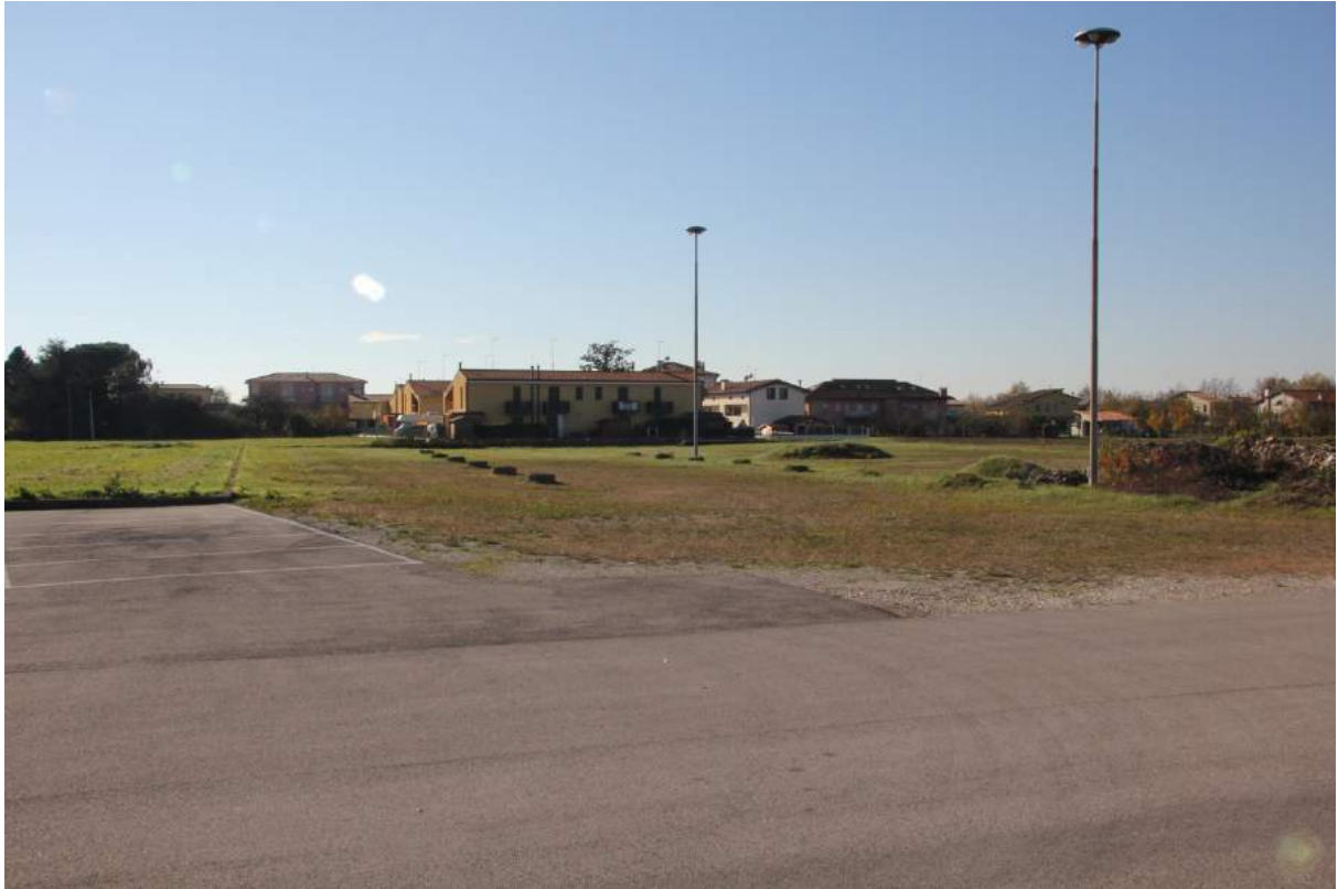
FOTO 1: vista da nord del lotto e foto inserimento dell'edificio in progetto