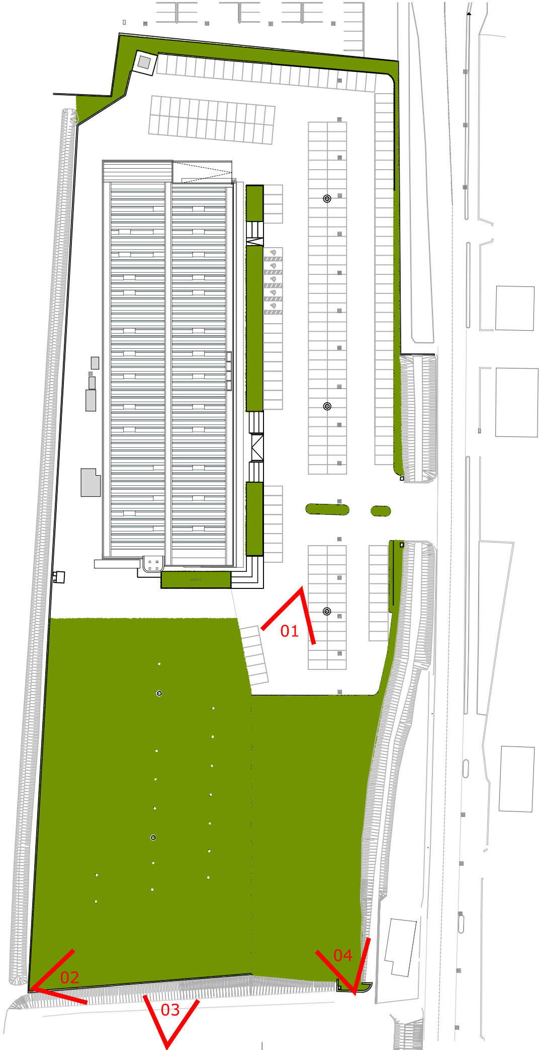
Planimetria generale - stato di fatto - con individuazione dei coni visuali - scala 1:1000