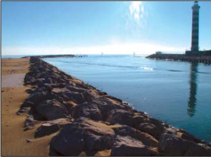
Figura 1.5 - Foce di fiume

tre sono caratterizzate da discreti valori di torbidità e da elevate temperature estive.