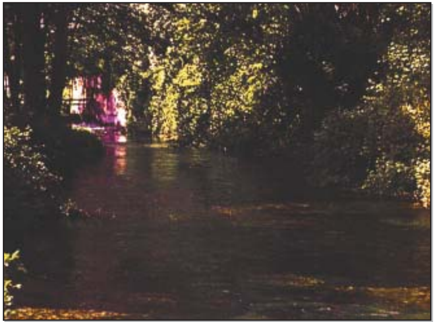
Figura 1.3 - Fiume di risorgiva

Le specie ittiche che caratterizzano questi corsi d'acqua sono lo spinarello ( Gasterosteus aculeatus ), il panzarolo ( Knipowitschia punctatissimus ) e la lampreda di ruscello ( Lethenteron zanandreae ) che associati a specie più comuni come il ghiozzo padano ( Padogobius martensii ), il luccio ( Esox lucius ) e il cobite comune ( Cobitis taenia ), costituiscono una comunità ittica particolare che non trova riscontro in altri ambienti d'acqua. Interessante è quindi la presenza di una specie tipica degli ambienti torrentizi di montagna, lo scazzone ( Cottus gobio ), che in queste zone si localizza nei tratti ghiaioso-ciottolosi e riesce a costituire delle