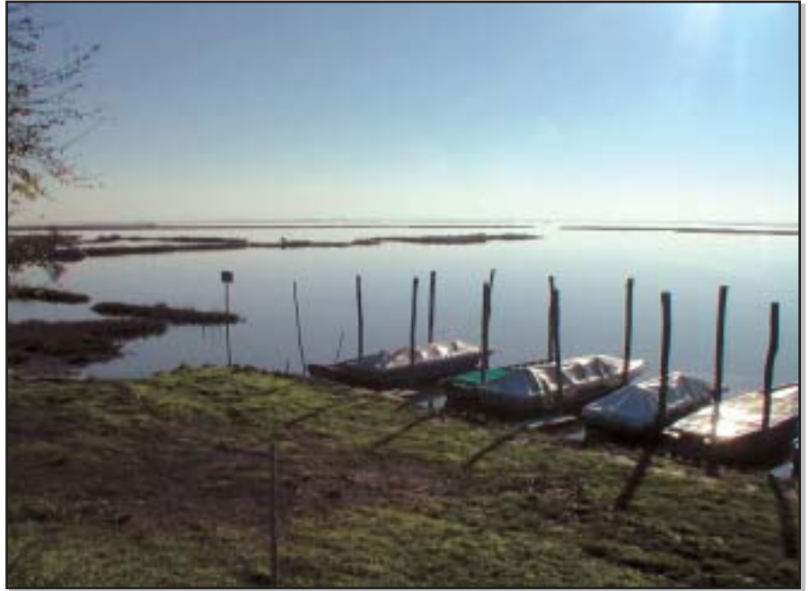
Figura 1.6 - La laguna

Per queste caratteristiche la laguna ospita ricchi popolamenti ittici sia di origine marina che d'acque salmastre ed è sede privilegiata per l'accrescimento degli stadi giovanili di molte specie, anche di elevato valore economico come l'orata ( Sparus auratus ), il branzino ( Dicentrarchus labrax ), la passera e i cefali.