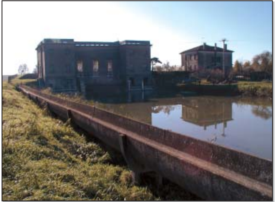
Figura 1.7 - Canale artificiale con idrovora

La prima è quella costituita dai tratti potamali dei grandi corsi d'acqua naturali, con sponde normalmente ben vegetate e regimi idrici dipendenti dalle situazioni climatiche del momento. La seconda è quella costituita appunto dal fitto reticolo di canali artificiali ad uso irriguo e di bonifica, con argini normalmente sgombri e il cui regime idraulico è fortemente condizionato dall'attività umana. Da queste due tipologie principali si stacca abbastanza nettamente la situazione idrografica della