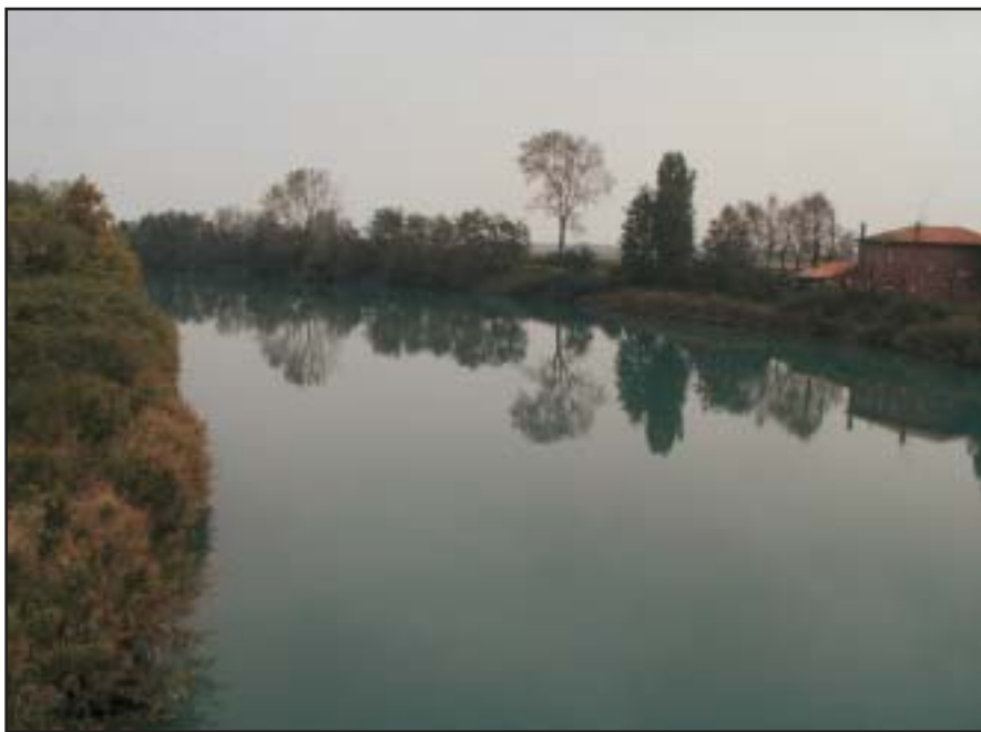
Figura 1.4 - Fiume di bassa pianura

Questa area comprende la maggior parte del territorio provinciale ed è in generale caratterizzata da acque a lento decorso con fondo fangoso-sabbioso e, spesso, abbondante vegetazione acquatica (Fig. 1.4).