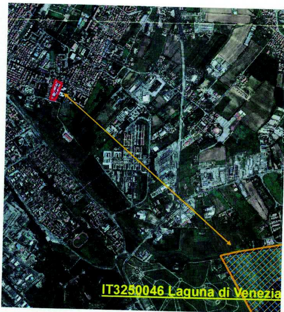
Aerofotogrammetria. In giallo il SIC/ZPS, in rosso è individuato il sito di intervento. La distanza minima dal sito è pari a 2.400 m ca (freccia gialla).

Di seguito si riporta stralcio della cartografia citata in cui si evidenzia che il confine della ZPS IT3250046 Laguna di Venezia e del SIC IT3250031 Laguna superiore di Venezia dista dall'area di intervento circa 2.400 m in direzione Sud. La porzione di terreno tra l'area di intervento ed il S.I.C/Z.P.S. è costituito da un contesto urbano, collegato da una rete viaria molto sviluppata, intervallato da aree verdi.