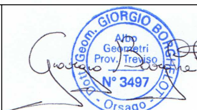
Tavola n. 02