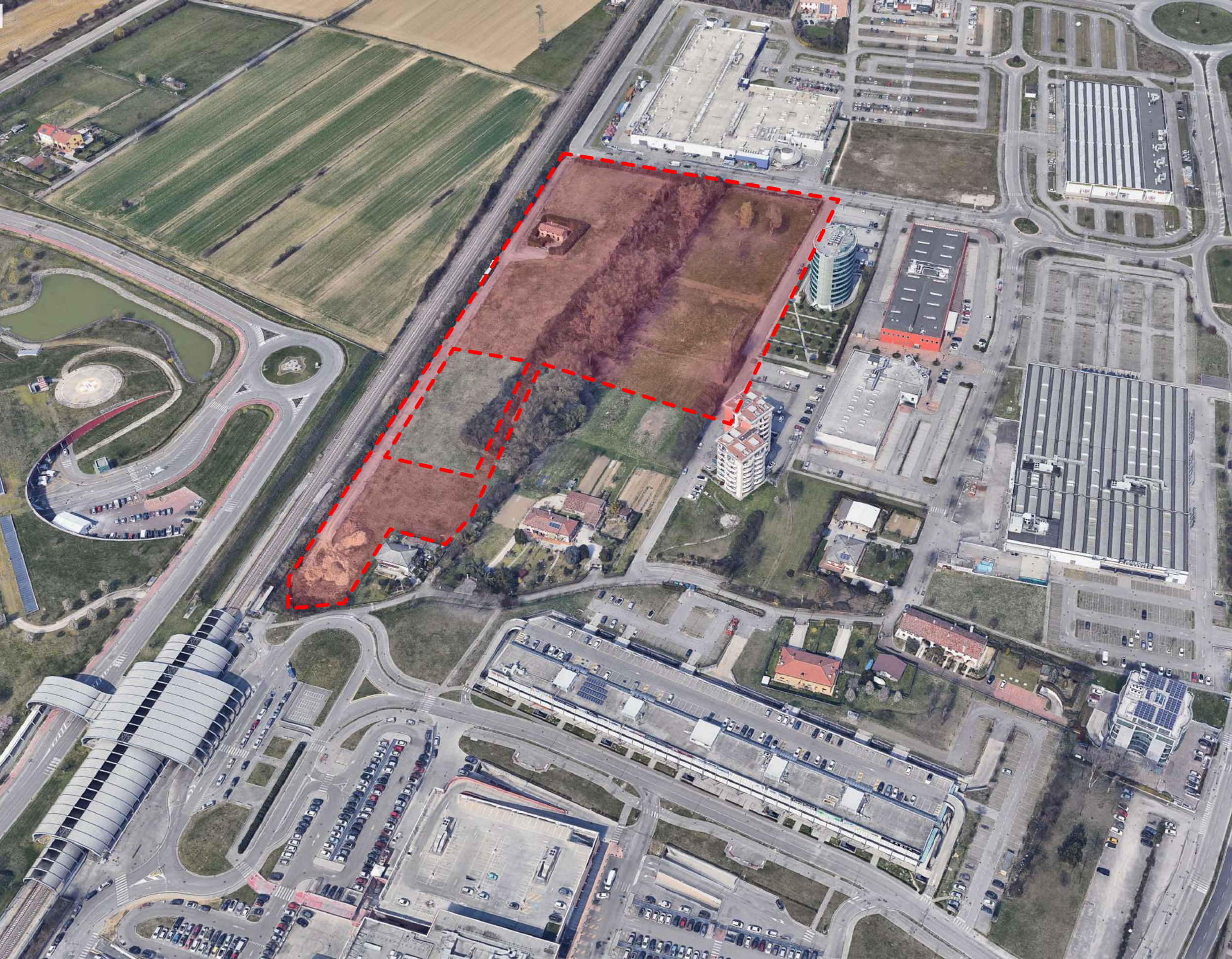
VISTA A VOLO D'UCCELLO DELL'AREA DI INTERVENTO