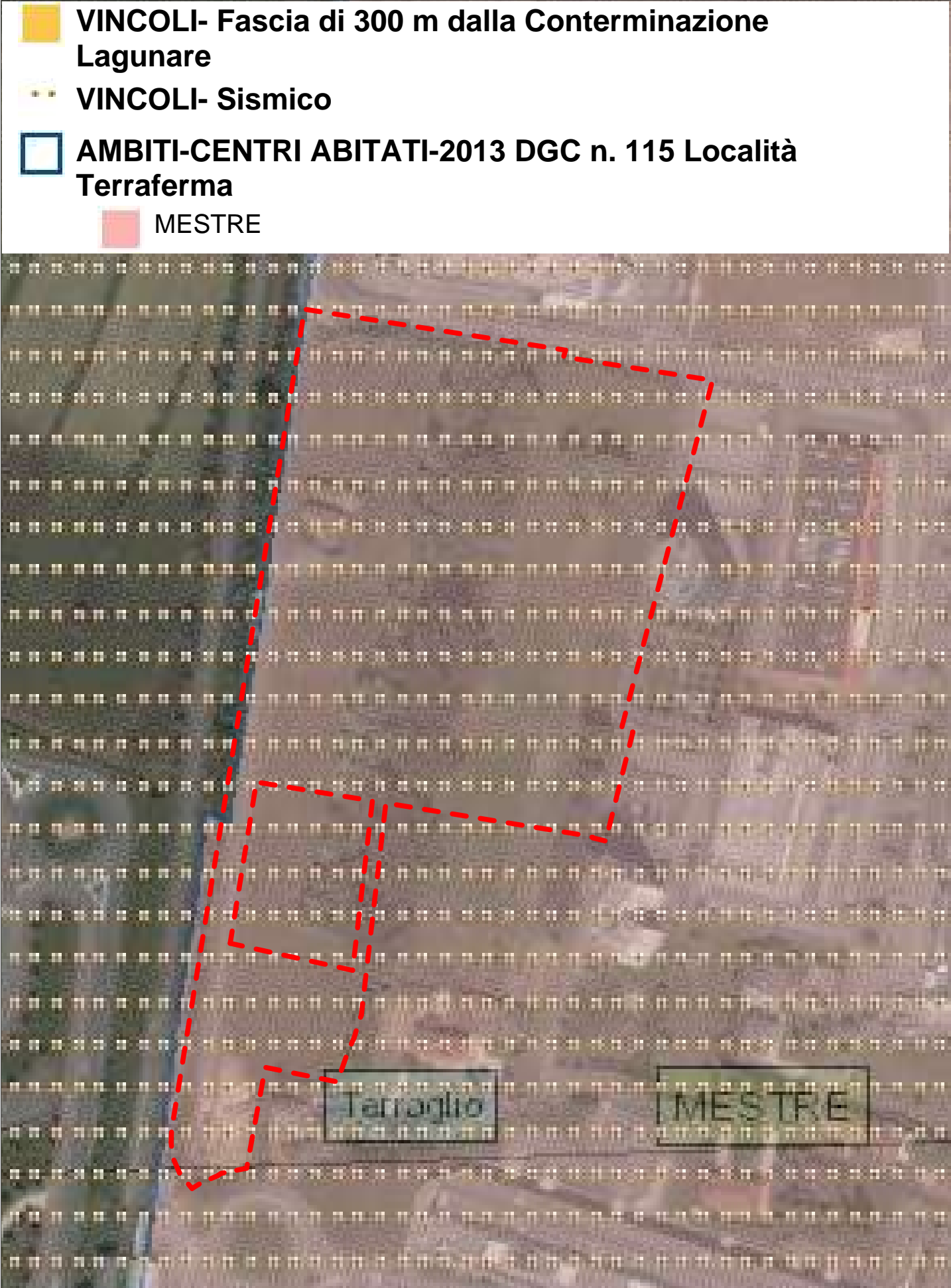
CARTA DEI VINCOLI 1:2000