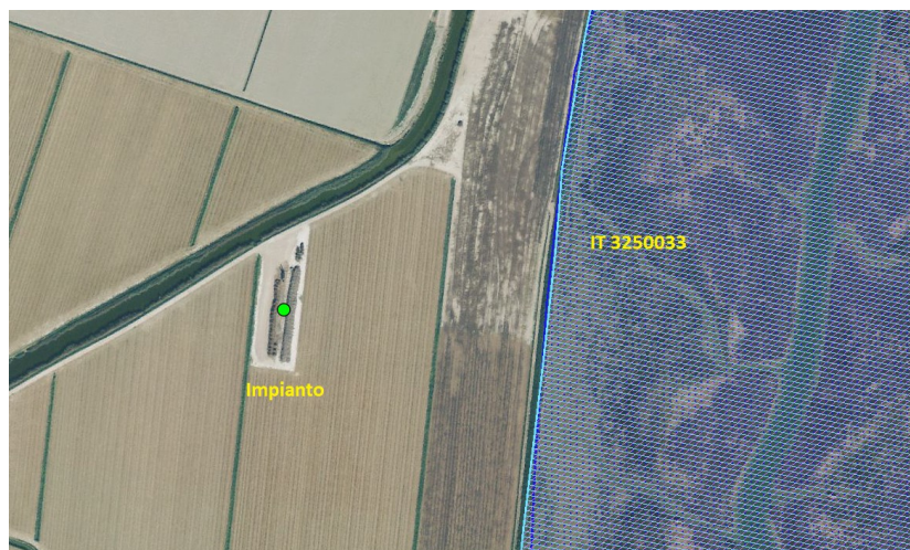
Immagine n. 2 – estratta dal sito del MATT