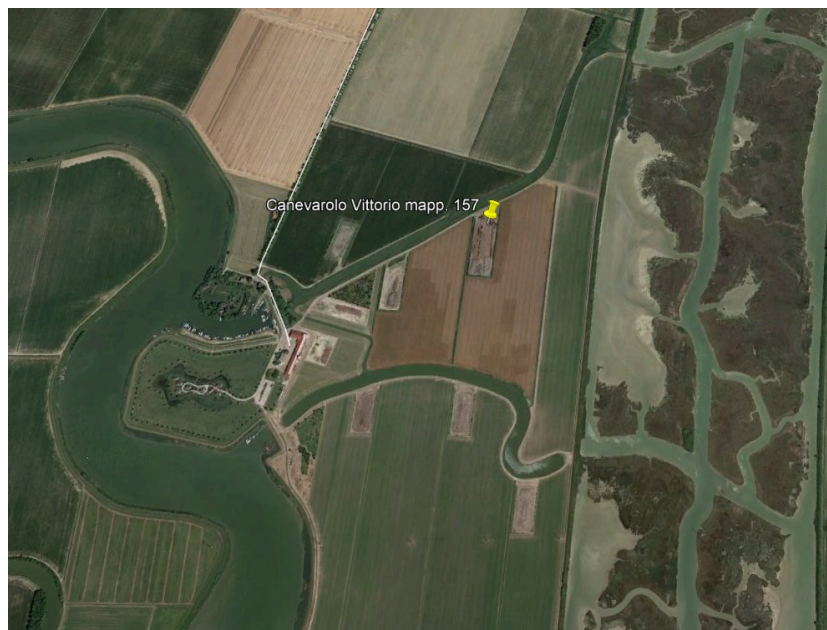
Immagine n. 1 estratta da Google Earth

L'immagine seguente, estratta da Google Earth, illustra l'ubicazione dell'impianto di compostaggio della ditta CANEVAROLO VITTORIO.