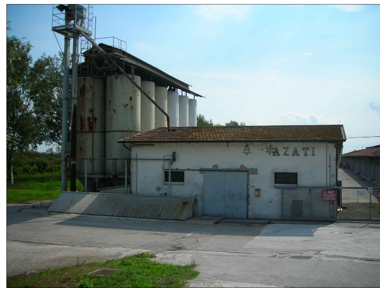
CONO OTTICO 2