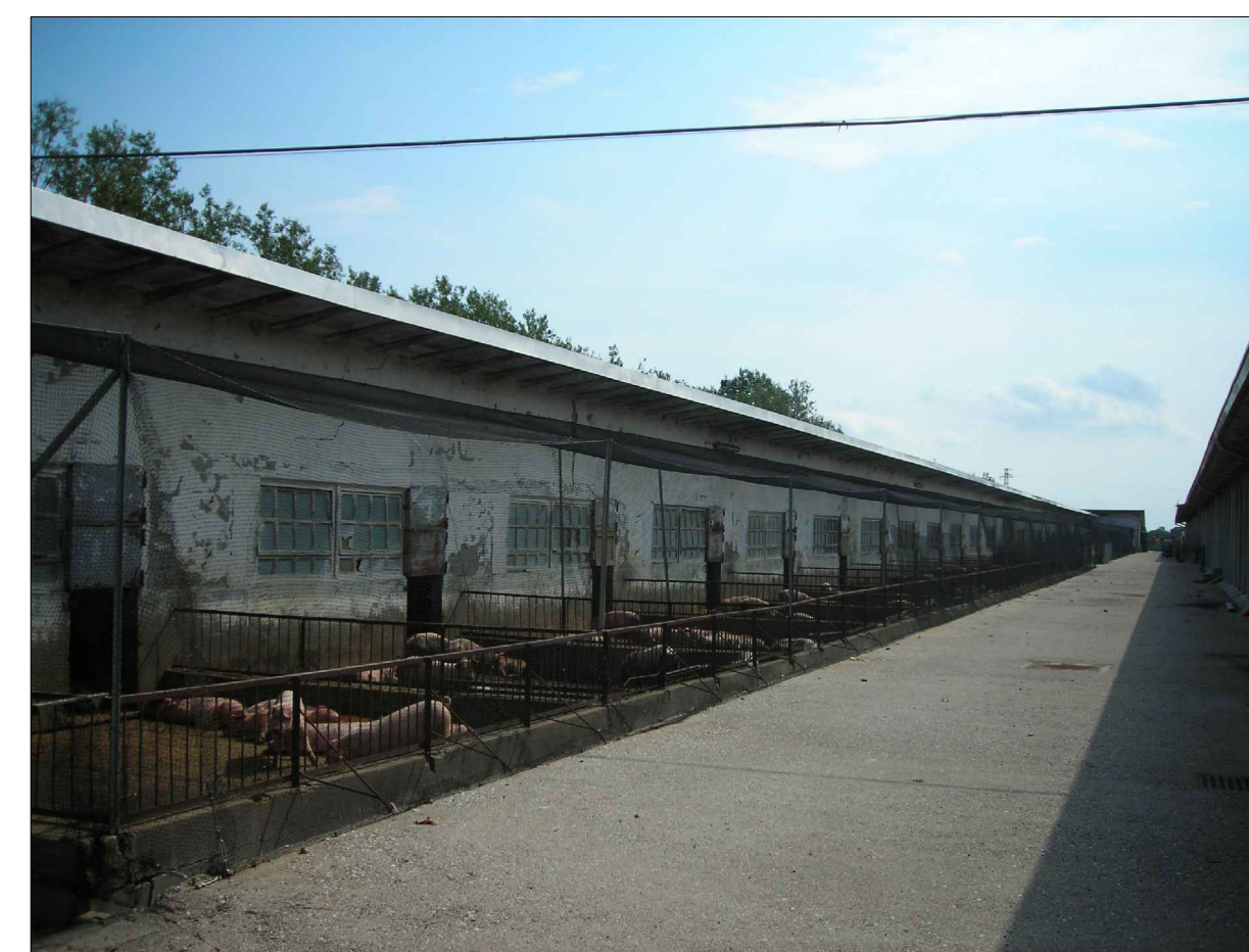
CONO OTTICO 4