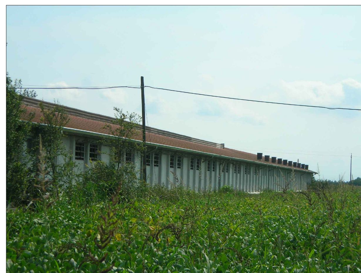
CONO OTTICO 3