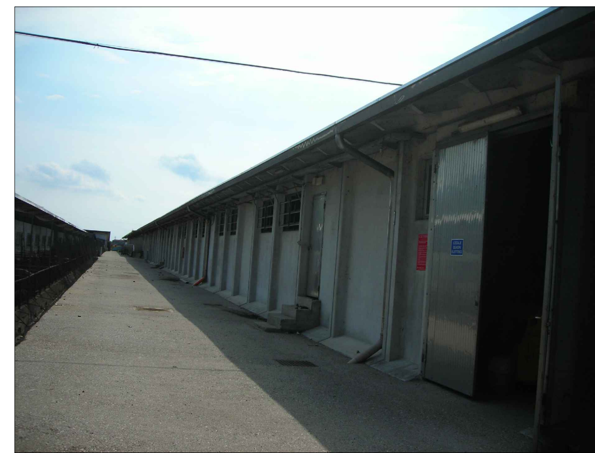
CONO OTTICO 5