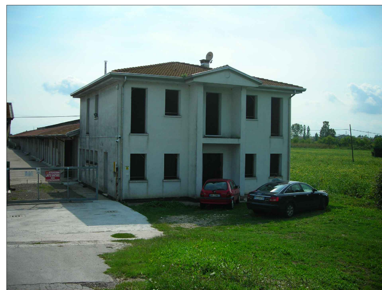
CONO OTTICO 1