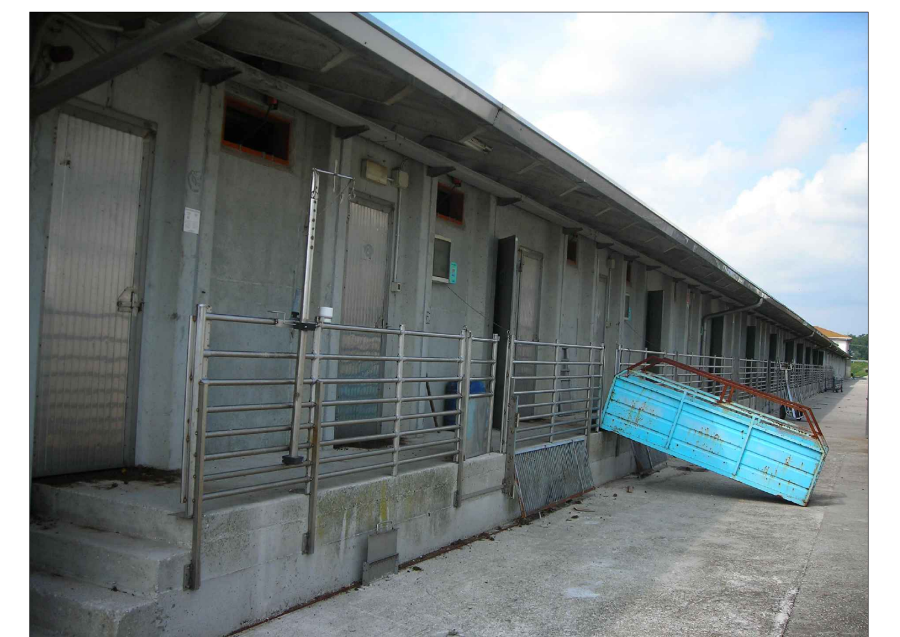
CONO OTTICO 9

Tav. n. : SALVATRONDA Via Natisone, 4 TEL.0423/490802-CASTELFRANCO V.TO (TV)- Geom. LUSTRO GIUSEPPE Comune di: QUARTO D'ALTINO Foglio n. Mappale n. 13 24-112 OGGETTO: PROGETTO RISTRUTTURAZIONE AZIENDA AGRICOLA - 1° LOTTO LAVORI Rilievo fotografico DITTA: LA CERCHIARA Società Agricola s.s. A NORMA DI LEGGE IL PRESENTE ELABORAZIONE È PROTETTA DA UN SISTEMA AUTOMATICO DI PREVENZIONE DELL'AUTENTICAZIONE DEL FOTOCOPIATO MONTAGNER MORBINO DI FORDO S/P al via all'atto: 20/10/2024 18:41:53 PROTOCOLLO GENERALE: 2024 / 12774 del 23/10/2024