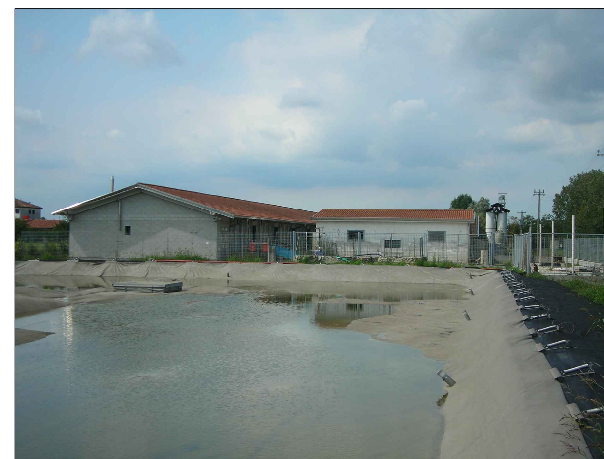
CONO OTTICO 6