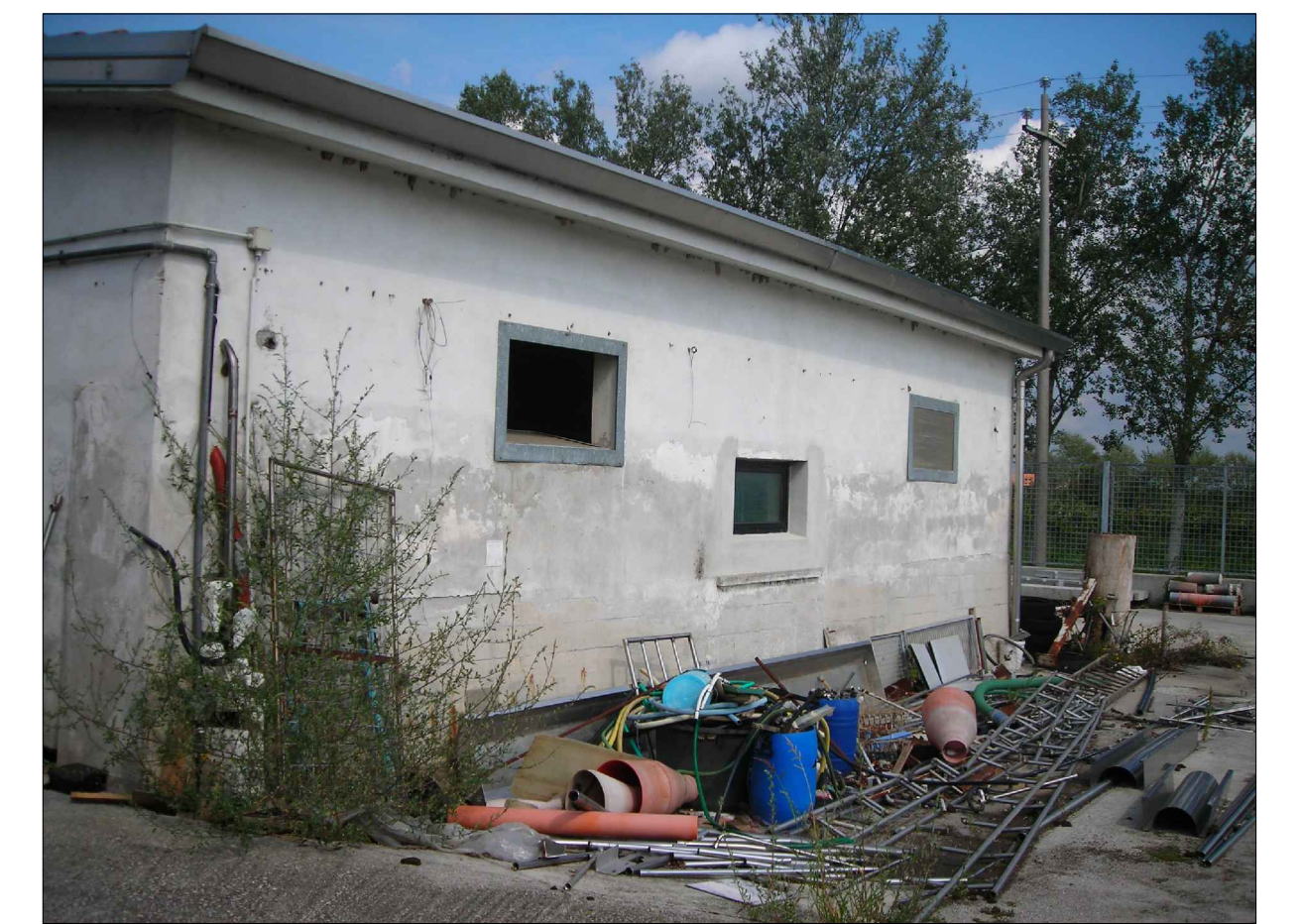
CONO OTTICO 8