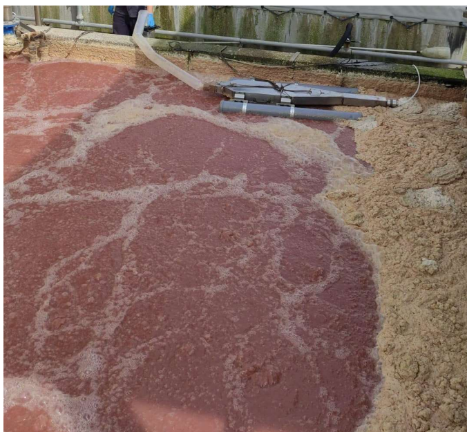
Figura 1: Foto vasca equalizzazione durante la caratterizzazione olfattometrica – stato attuale

Come si può osservare dalla Figura 1, la vasca di equalizzazione essendo aerata presenta un certo moto superficiale dell'acqua; inoltre, in alcune situazione vi è la presenza di materiale galleggiante.