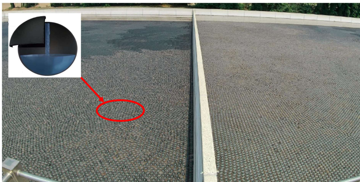
Figura 2: Foto applicazione copertura galleggiante su vasca stoccaggio reflui e dettaglio sfera

Nelle figure seguenti si riporta un tipo di applicazione con dettaglio dell'interno della sfera e relativa descrizione della struttura.