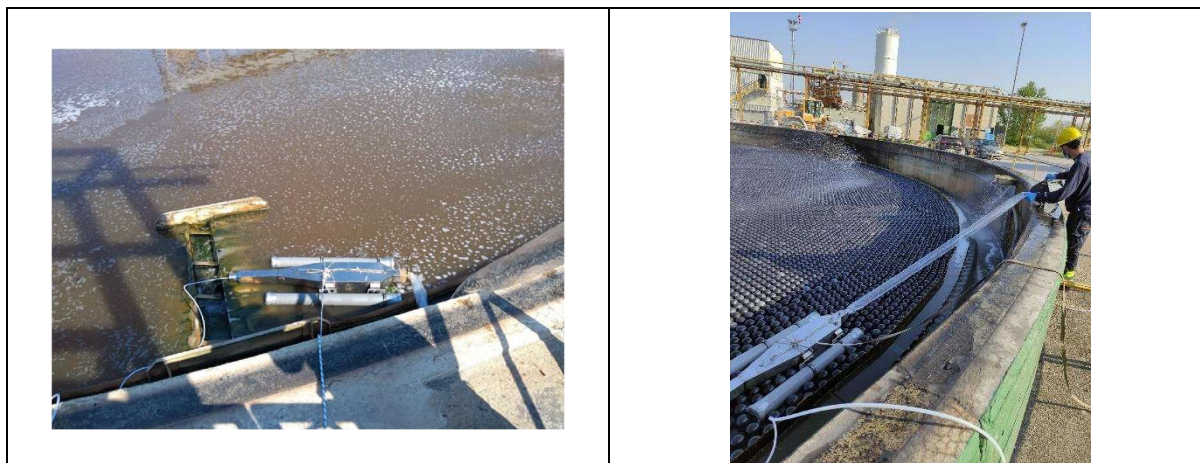
Figura 4: a sinistra foto della vasca ante copertura galleggiante, mentre a destra la foto della vasca post copertura con "Coverball" e sistema lavaggio attivo

A seguito dell'installazione della copertura galleggiante con sfere della Coverball sono state eseguite successive campagne di caratterizzazione comprese fra gli anni 2021 e 2023 e riportate nella tabella successiva. Il valore di 165 ou E /m 3 della 4° campagna di caratterizzazione è stato ottenuto caratterizzando il potenziale emissivo con sfere di copertura parzialmente sporche e sistema di pulizia spento. Tale risultato conferma la necessità di mantenere la copertura galleggiante pulita per evitare che eventuale materiale sospeso vada a sedimentare sopra la sfera.