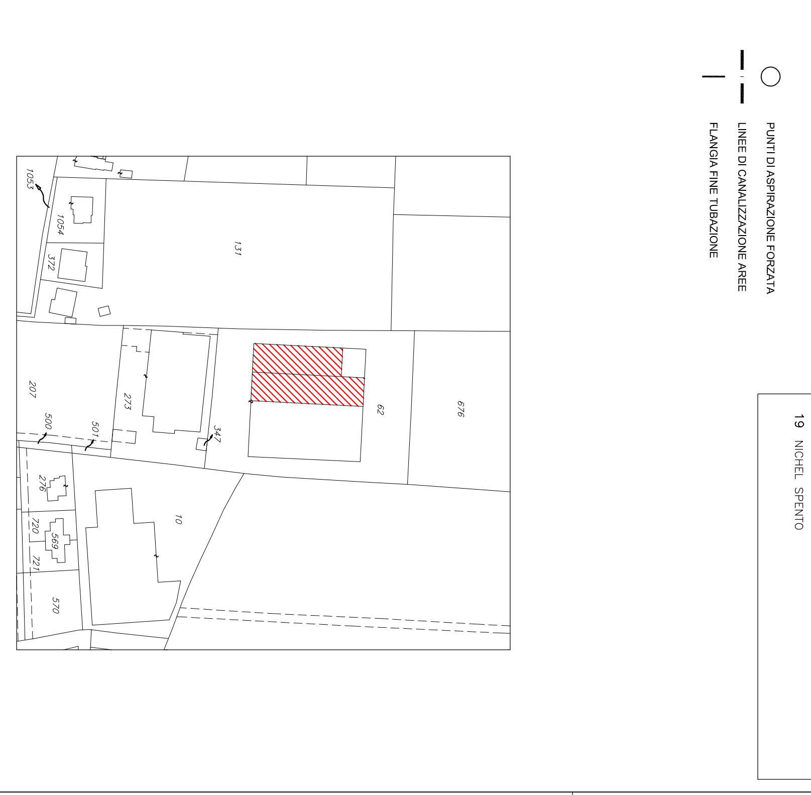
ESTRATTO MAPPA CATASTALE scala 1:2000 Comune di Marcon - Fg. 5 - Mapp. 62