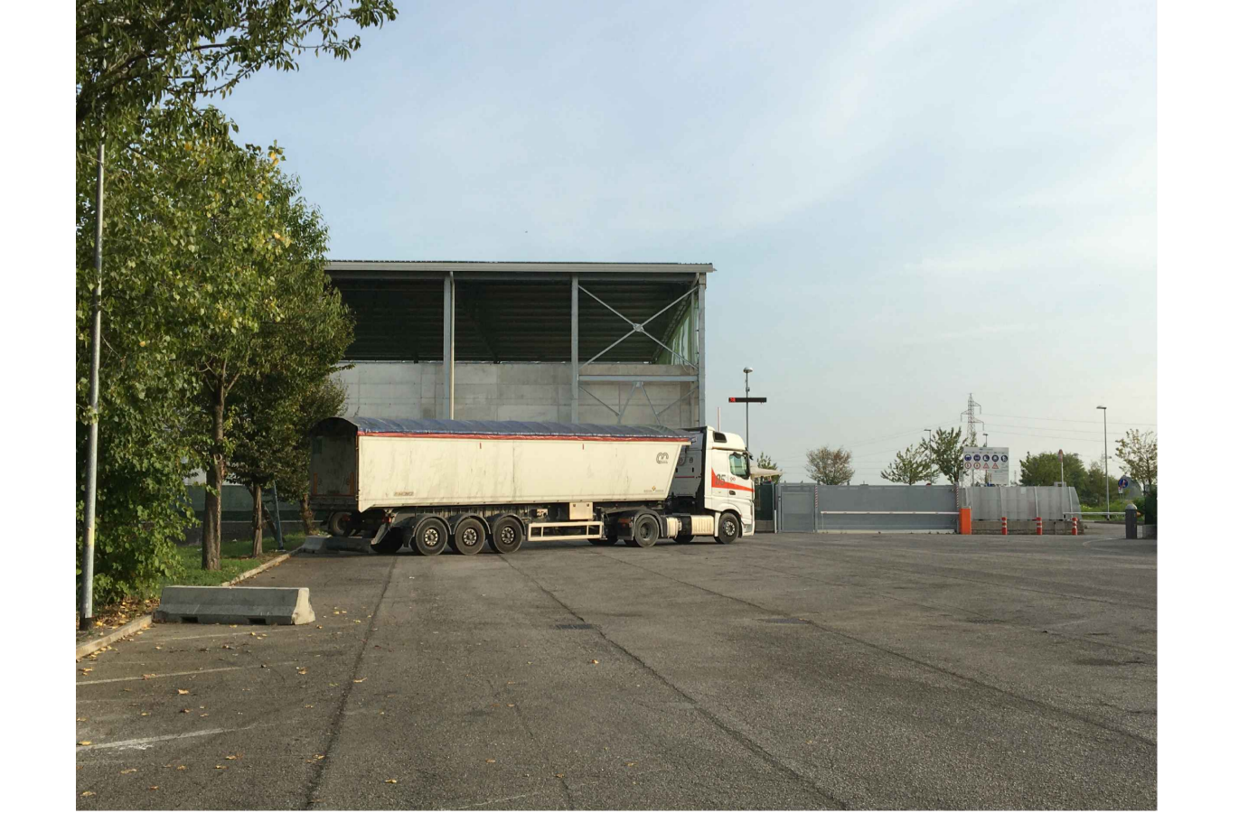
Fig. 01 - Vista parcheggio lato Nord Riproduzione cartacea del documento informatico sottoscritto digitalmente da DUS LORIS il 18/11/2021 15:08:28 MASSARO DAVID il 17/11/2021 13:01:56