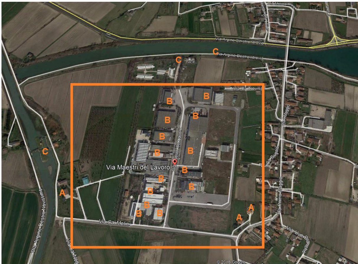
Immagine n. 1

Gli obiettivi sensibili presenti nell'area indagata sono stati raggruppati nelle seguenti due categorie: