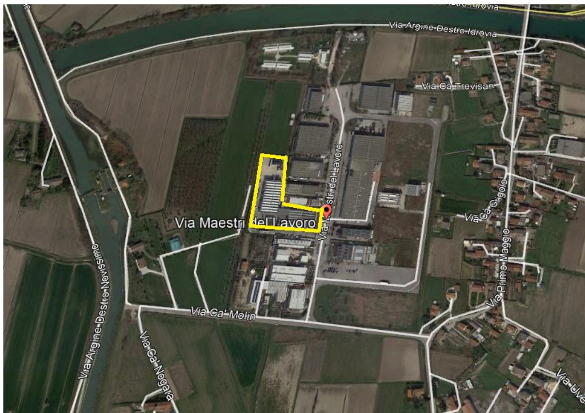
Immagine n. 3

Considerato il basso rischio idraulico, si ritiene aderente alla realtà ricercare le cause di un potenziale allagamento dello stabilimento nell'incapacità, da parte del sistema di captazione delle acque meteoriche a servizio dell'impianto, di far defluire le stesse a seguito di un'anomala nonché imprevedibile precipitazione.