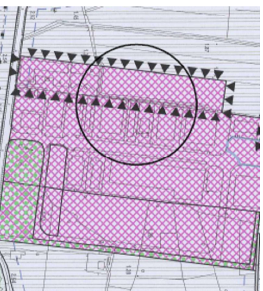
ESTRATTO VARIANTE AL PRG - ZTO D1:10