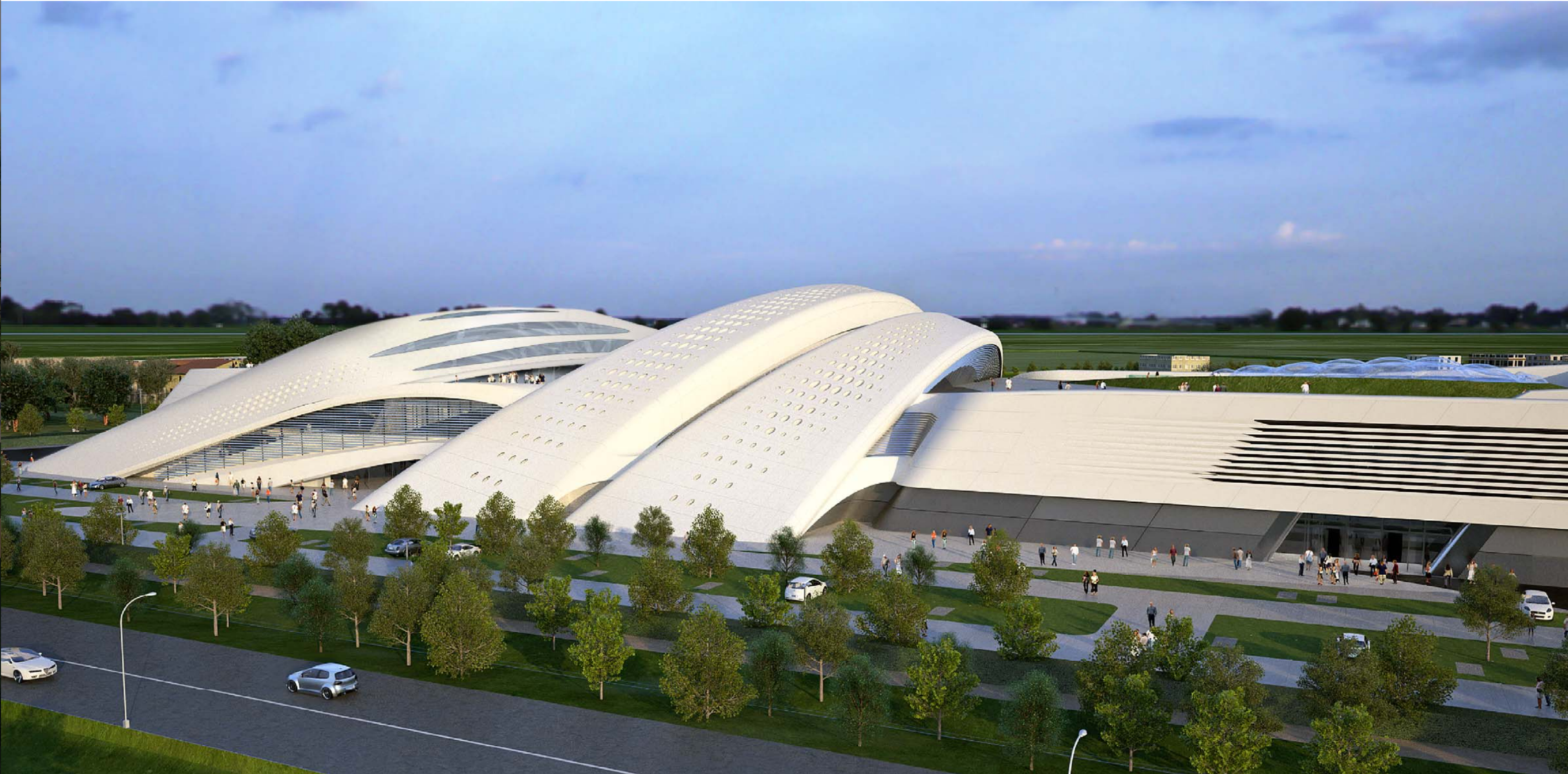
02 VISTA AREA OVEST