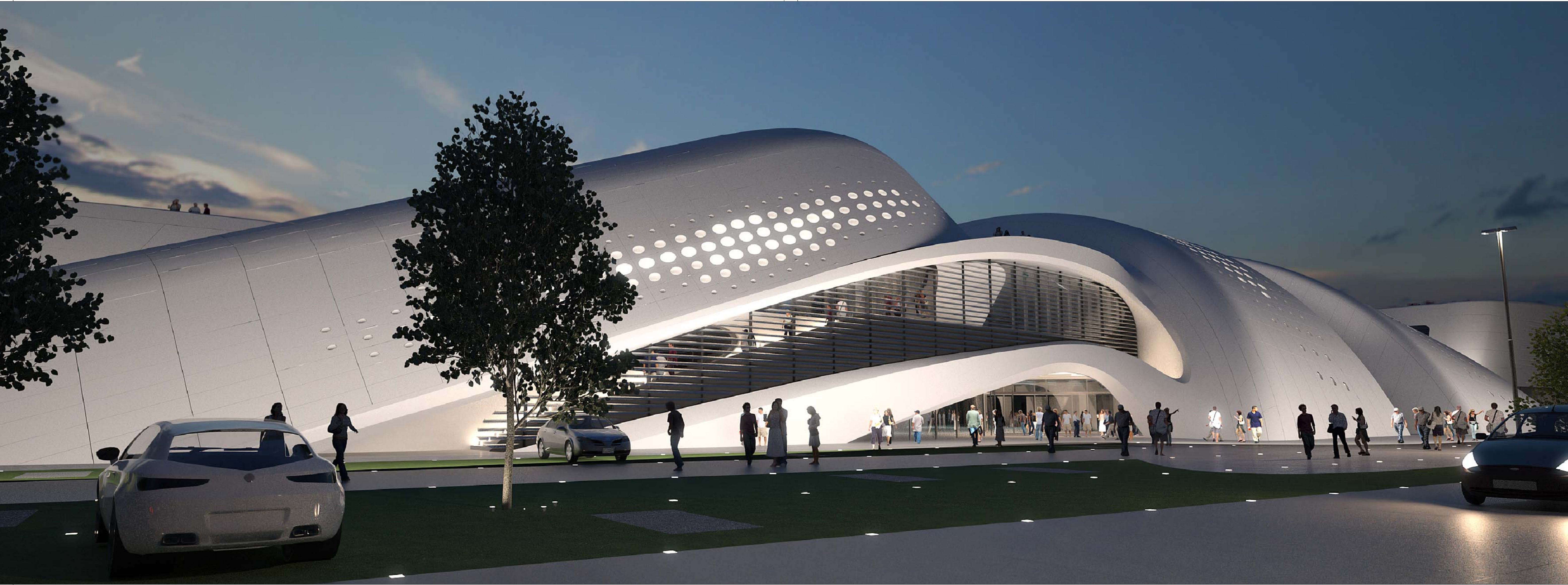
03 VISTA INGRESSO NORD

Progetto NUOVO POLO COMMERCIALE E POLIFUNZIONALE AREA EX CATEL COMUNE di JESOLO (Venezia)