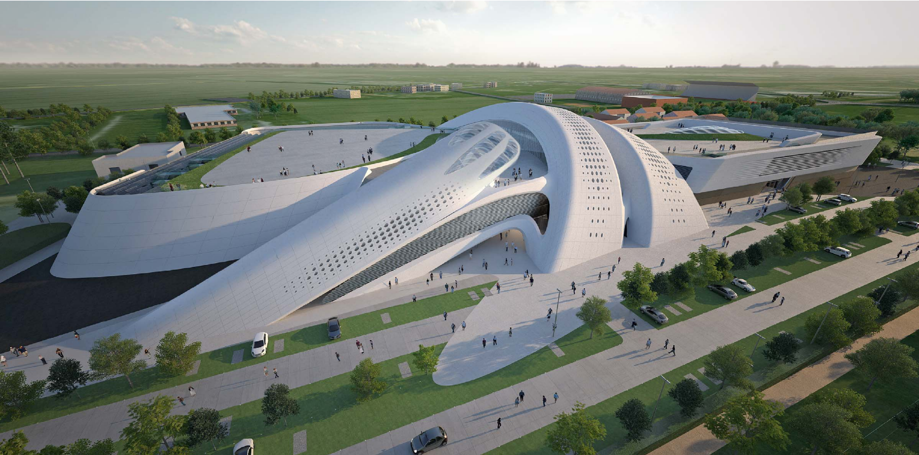
01 VISTA AEREA - NORD OVEST