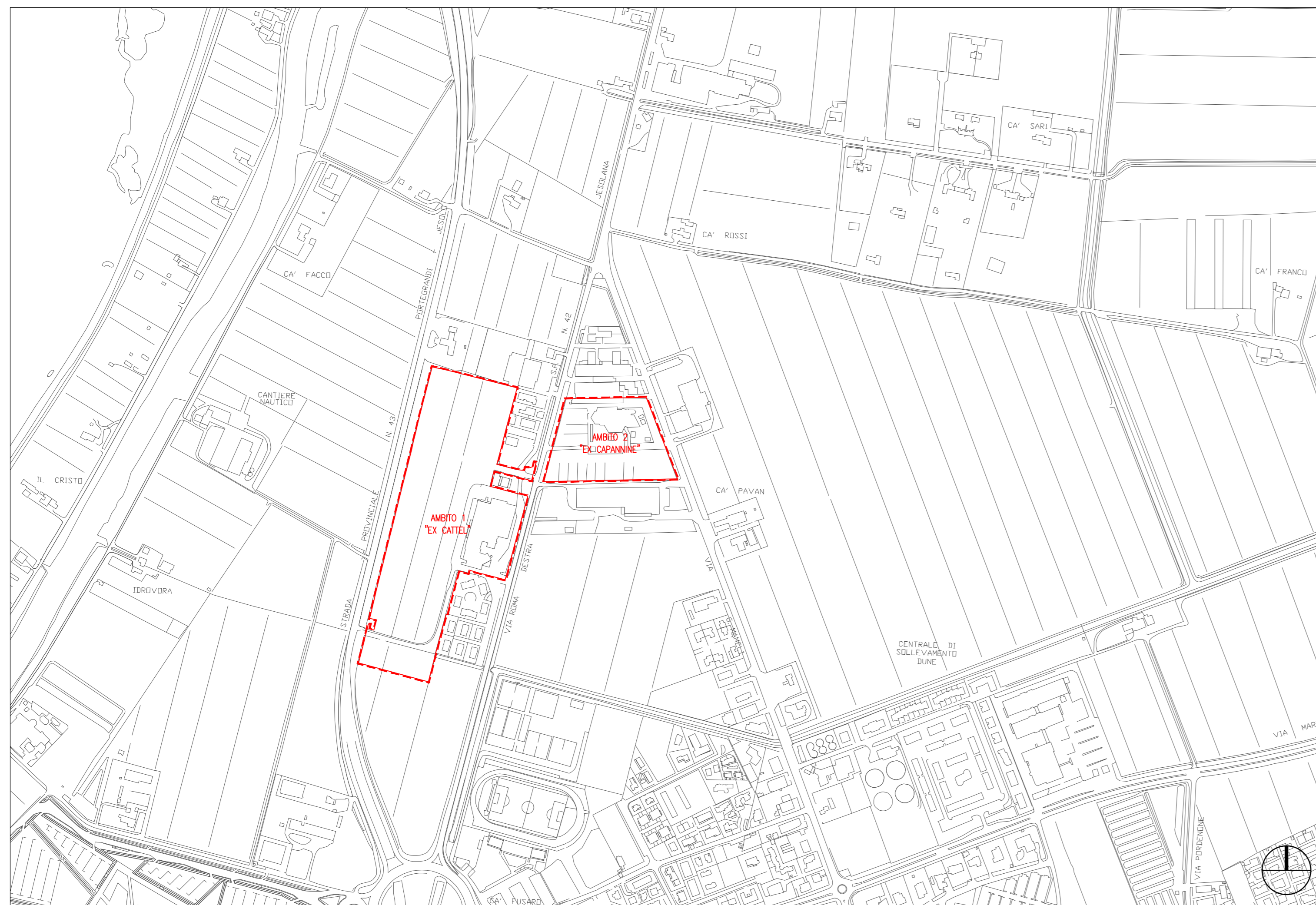
ESTRATTO CARTA TECNICA REGIONALE